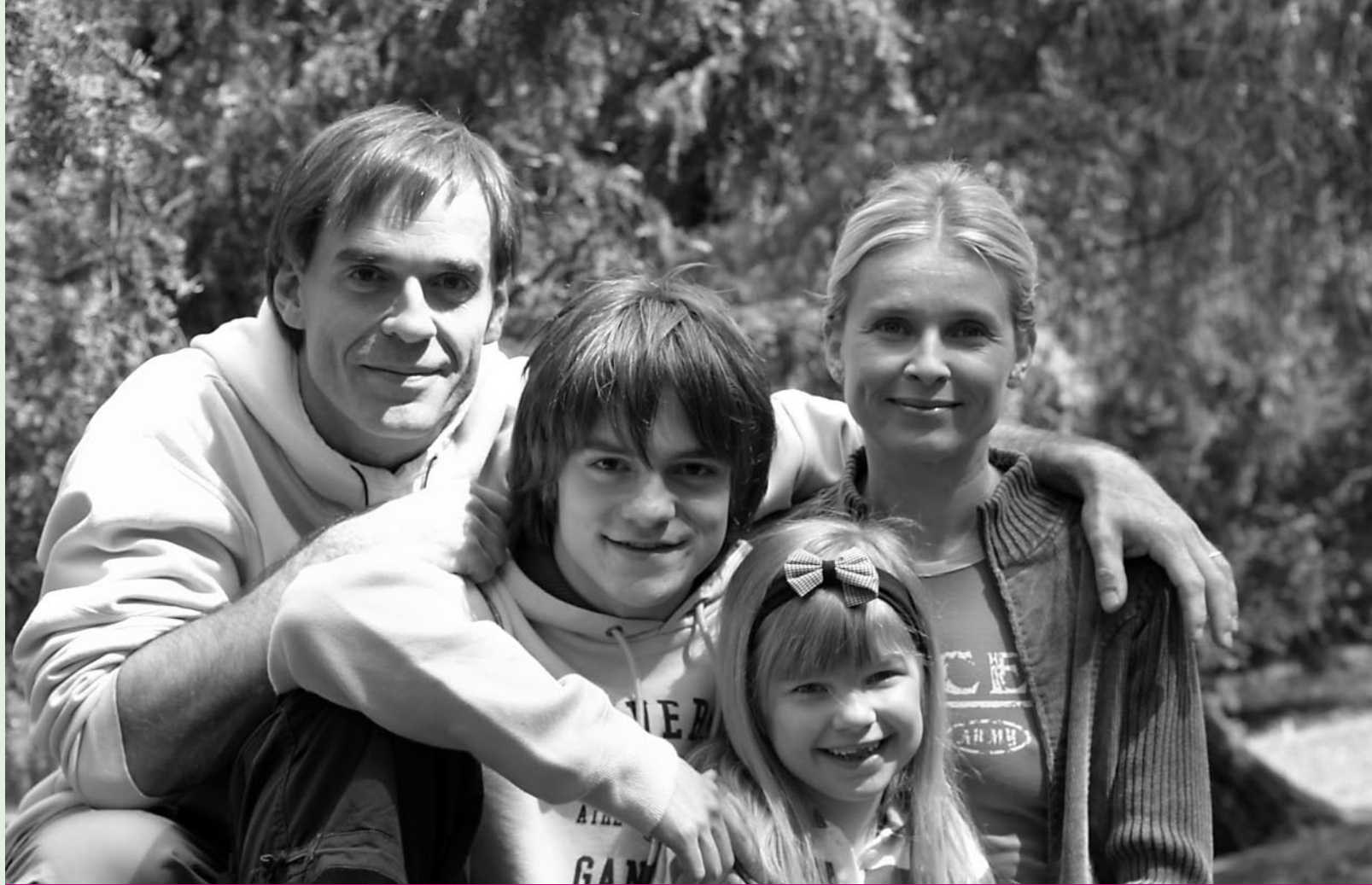
filmové premiéry a novinky