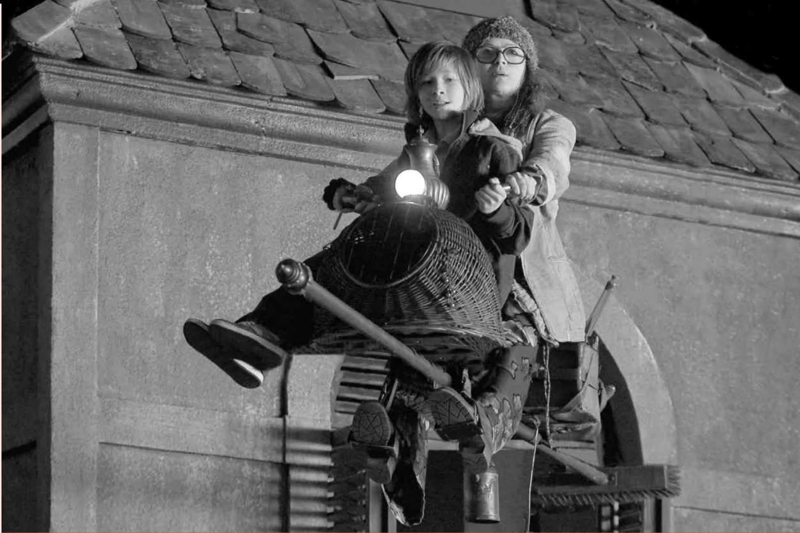
Filmové premiéry a novinky